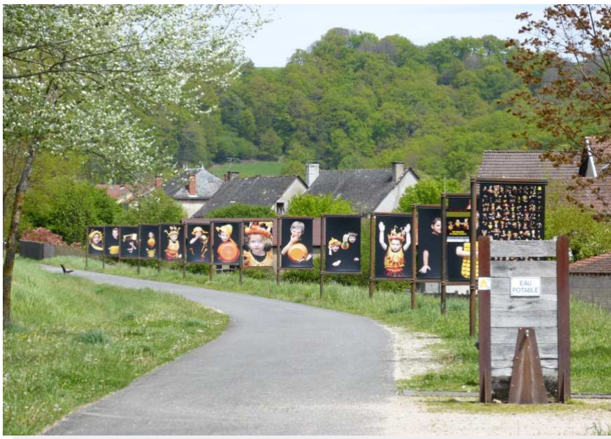
Exposition photographique de Pierrick Delobelle, tirée du projet départemental « A toi de jouer, Claire Dé », 2015

Trois zones d'implantations sur la piste verte : Ydes, Bassignac et Cheyssac.